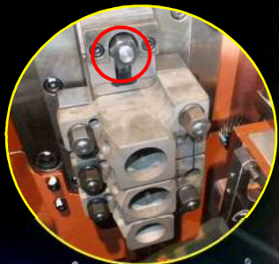
面付け装置 (オプション)